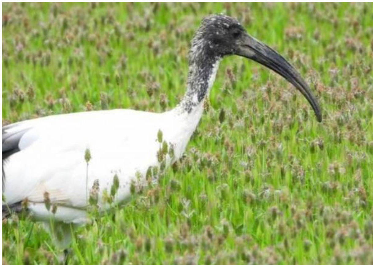
Ibis sacro africano